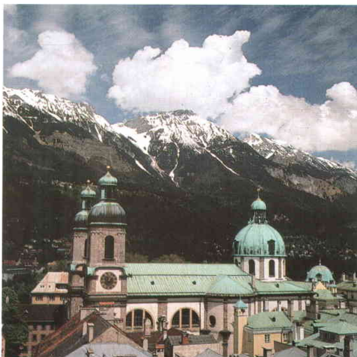
A la izquierda, la puerta de Steyr, una de las ciudades más antiguas del país. A la derecha, la catedral de Innsbruck.