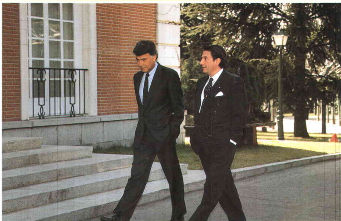
Francisco Vázquez, con el Presidente del Gobierno, Felipe González, en febrero de 1992.

de las causas de las controversias, adaptándolos a la estructura del gasto de las Corporaciones Locales y no al de las Comunidades Autónomas como pretendía el Gobierno. Aquellas negociaciones fueron muy difíciles, incluso tensas en ocasiones. Pero yo creo que lo que tuvo mayor trascendencia fue la firma del Protocolo sobre Financiación de agosto de 1994, que establecía el nuevo sistema de participación en los Tributos del Estado para el quinquenio 1994-1998. Aquel Acuerdo establecía un índice de evolución basado en unos parámetros claros: como máximo el PIB y como mínimo el IPC. Al mismo tiempo, permitía el acceso a la financiación de los Fondos Comunitarios para las Corporaciones Locales. A la vista de las circunstancias -política de rigor presupuestario y la necesidad de alcanzar los objetivos de convergencia económica con la Unión Europea- el Acuerdo ha sido claramente beneficioso.