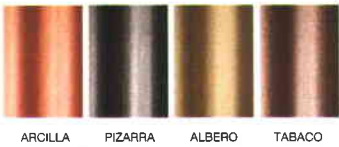
ARCILLA PIZARRA ALBERO TABACO

Uralita Placa Terra es la solución perfecta para integrar los nuevos proyectos de todo municipio, en ese tono general que da carácter a un pueblo. ¡Defendamos nuestros colores para siempre!