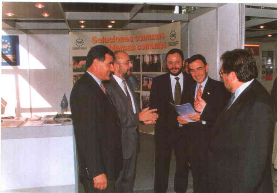
El Consejero de Gobernación de la Generalidad de Cataluña, Javier Pomés, que presidió el acto inaugural, junto a las demás autoridades, ojea Carta Local, ante el stand de la FEMP.

L os días 17 al 20 de octubre se celebró en Lérida una nueva edición del Salón Internacional de Equipamientos Urbanos, Municipalia'95, a la que asistieron más de 20.000 visitantes profesionales y técnicos de municipios que pudieron conocer de primera mano las novedades ofrecidas por 150 expositores presentes en el certamen.