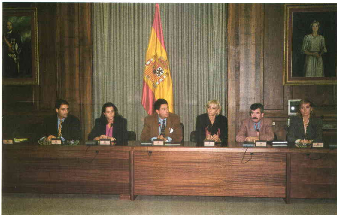
La delegación de la FEMP durante la rueda de prensa posterior a la reunión.