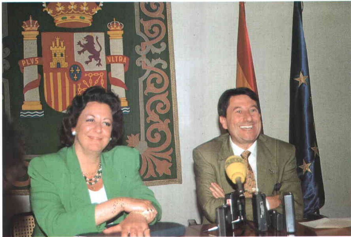
Francisco Vázquez y Rita Barberá, Alcaldesa de Valencia, en una rueda de prensa posterior a la Comisión Ejecutiva de la FEMP.

dante su presencia a través de la FEMP en todos los procesos de desarrollo normativo o legislativo de carácter sectorial y en el desarrollo de programas con otras Administraciones Públicas. Por poner unos ejemplos, hemos entrado a formar parte de la Mesa de la Función Pública, en el Consejo Nacional de Seguridad Ciudadana, en la Conferencia Sectorial de la Vivienda, en los grupos de expertos para estudiar las posibilidades de modificar la legislación sobre suelo, en los órganos de la promoción económica y el empleo, etc. Yo creo que si tomamos un poco de perspectiva podemos ver que hay cuestiones como las infraestructuras, las comunicaciones, las dotaciones para el ocio y la cultura, el deporte, los servicios sociales y otros, en los que hemos avanzado considerablemente. En cualquier caso, como decía, soy consciente de que las necesidades de los ciudadanos son tan amplias y crecientes que probablemente ningún representante público pueda decir nunca que ha cubierto sus objetivos.