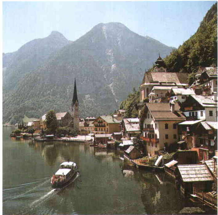
A la izquierda, una vista de Salzburgo. A la derecha, la ciudad de Hallstatt, en la Región de los Lagos de Alta Austria.

Los procesos electorales locales se producen cada seis años, tras la convocatoria que realiza cada Estado. Trece municipios, todos ellos grandes ciudades que disponen de un Estatuto especial, tienen la capacidad de elegir la fecha de celebración de las elecciones. Estas ciudades son: Eisenstadt, Graz, Innsbruck, Klagenfurt, Krems, Linz, Salzburgo, Saint Pölten, Viena, Villach, Waidhofen/Ybbs y Wiener Neustadt.